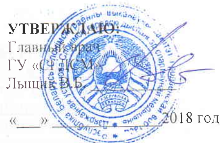
ГРАФИК прохождения углубленного медицинского осмотра организациями г. Слонима и Слонимского района в Государственном учреждении «Слонимский городской диспансер спортивной медицины» ул. Черняховского,1 На 2-ое полугодие 2018г.